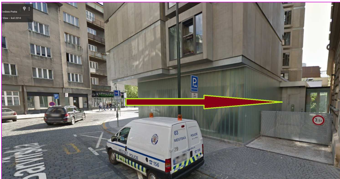
Křižovatka ulic Barvířská a Lodecká