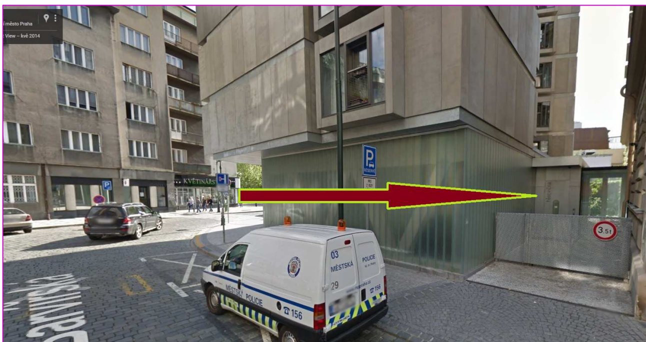
Křižovatka ulic Barvířská a Lodecká